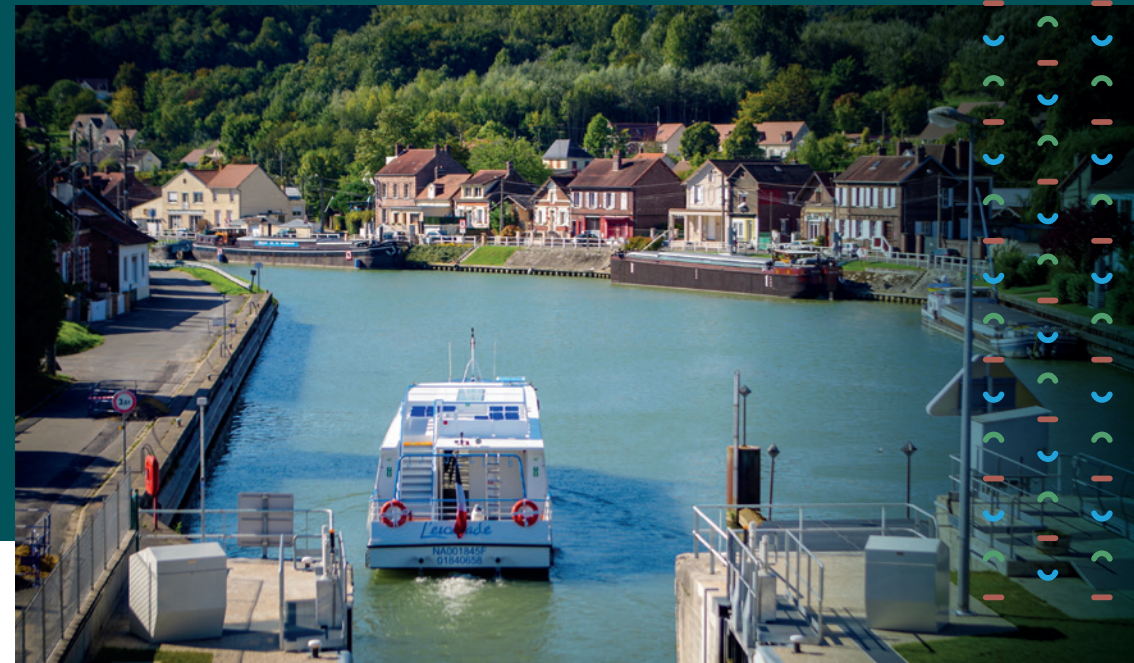
Credits photos : Sophie Martineaud, Oise Tourisme, CC2V, X. RENOUX, Bruno BEUCHER, Jean-Pierre GILSON, Amélie-Sophie FLAMENT - Conception graphique : Grafitti.fr

→ La Cité des Bateliers est une aventure proposée par la Communauté de Communes des Deux Vallées.